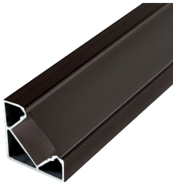
DIAGRAMA DE MEDIDAS